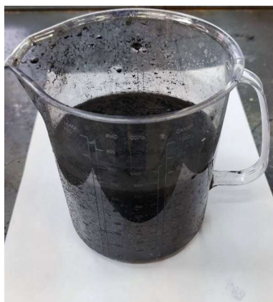
Рис. 2. Фото графено-водного теплоносителя