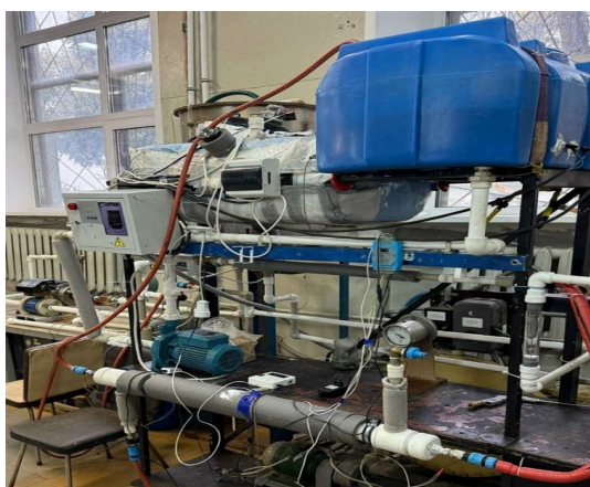
Рис. 1. Общий вид экспериментального стенда