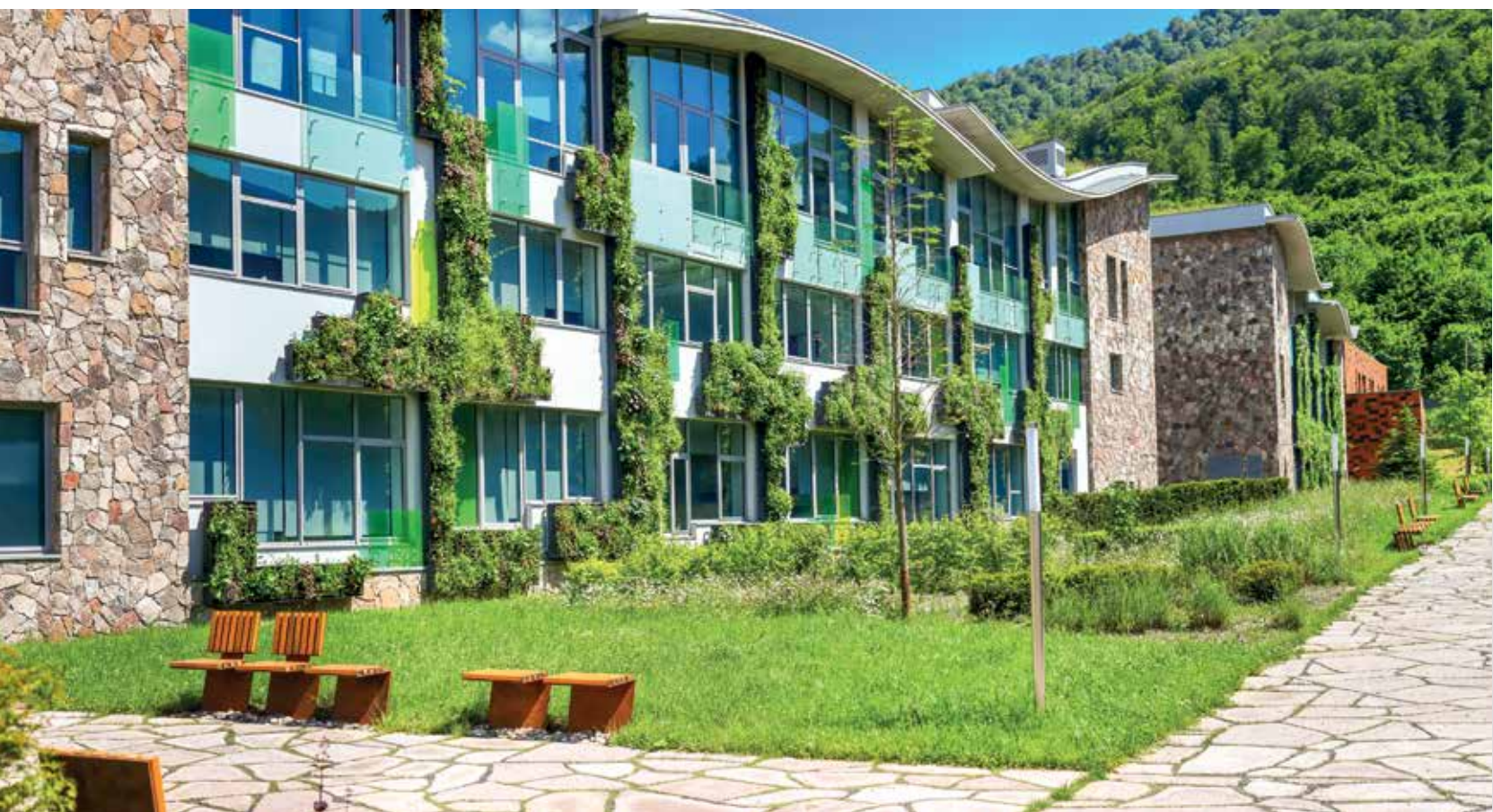
☛ Задуманная в 2006 году школа открыла двери для первых студентов в 2014 году