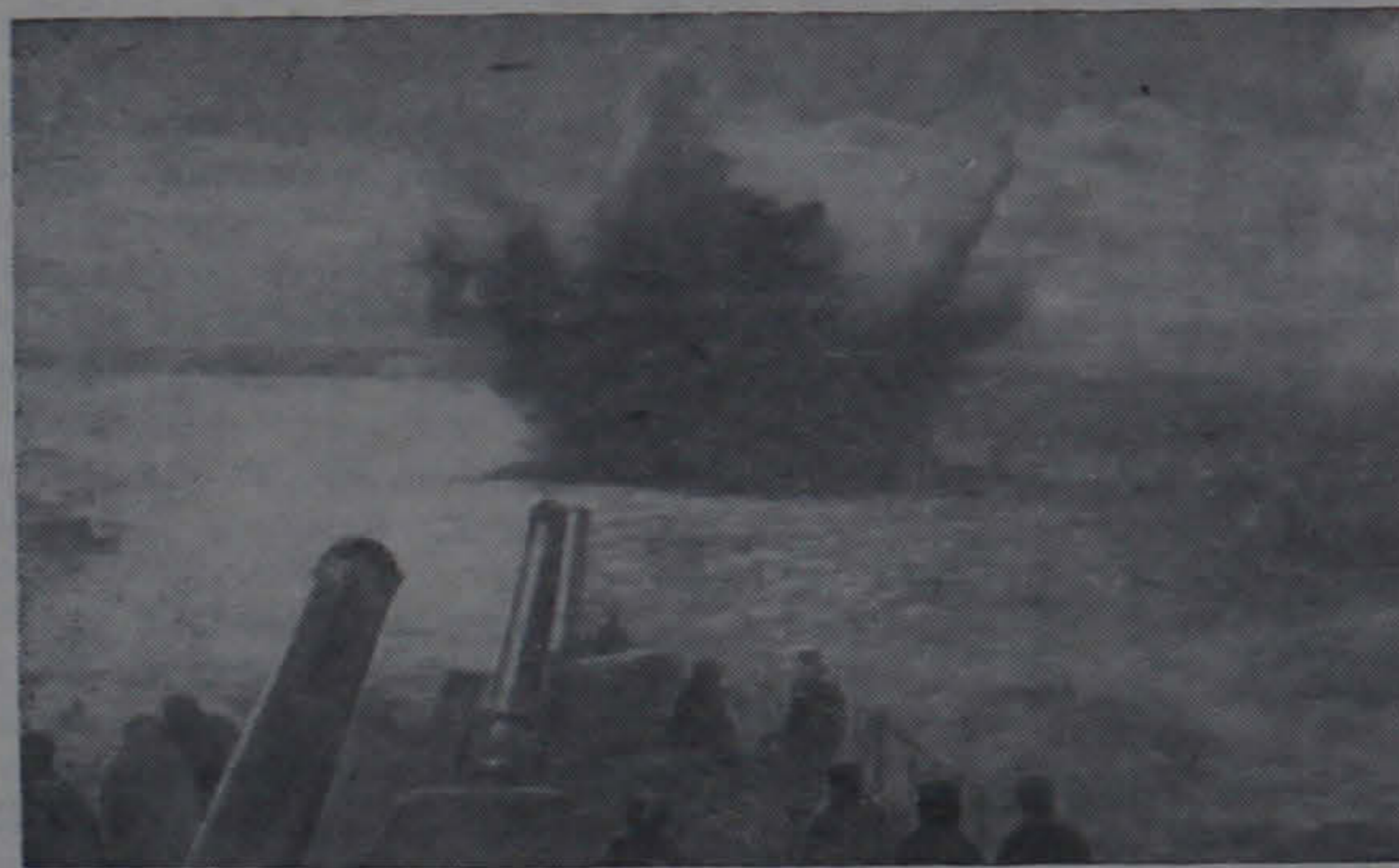
Вражеская подводная лодка поражена. Эсминец «Урицкий» 1944 г.

Кончался 1944 год. Советская Армия проводила наступательные операции по освобождению Крайнего Севера, части территории Финляндии и Норвегии. Наша авиация принимала активное участие в этих операциях. Эсминец «Урицкий» в составе Северного флота обеспечивал десант. И вдруг на расстоянии 0,5 мили упал наш