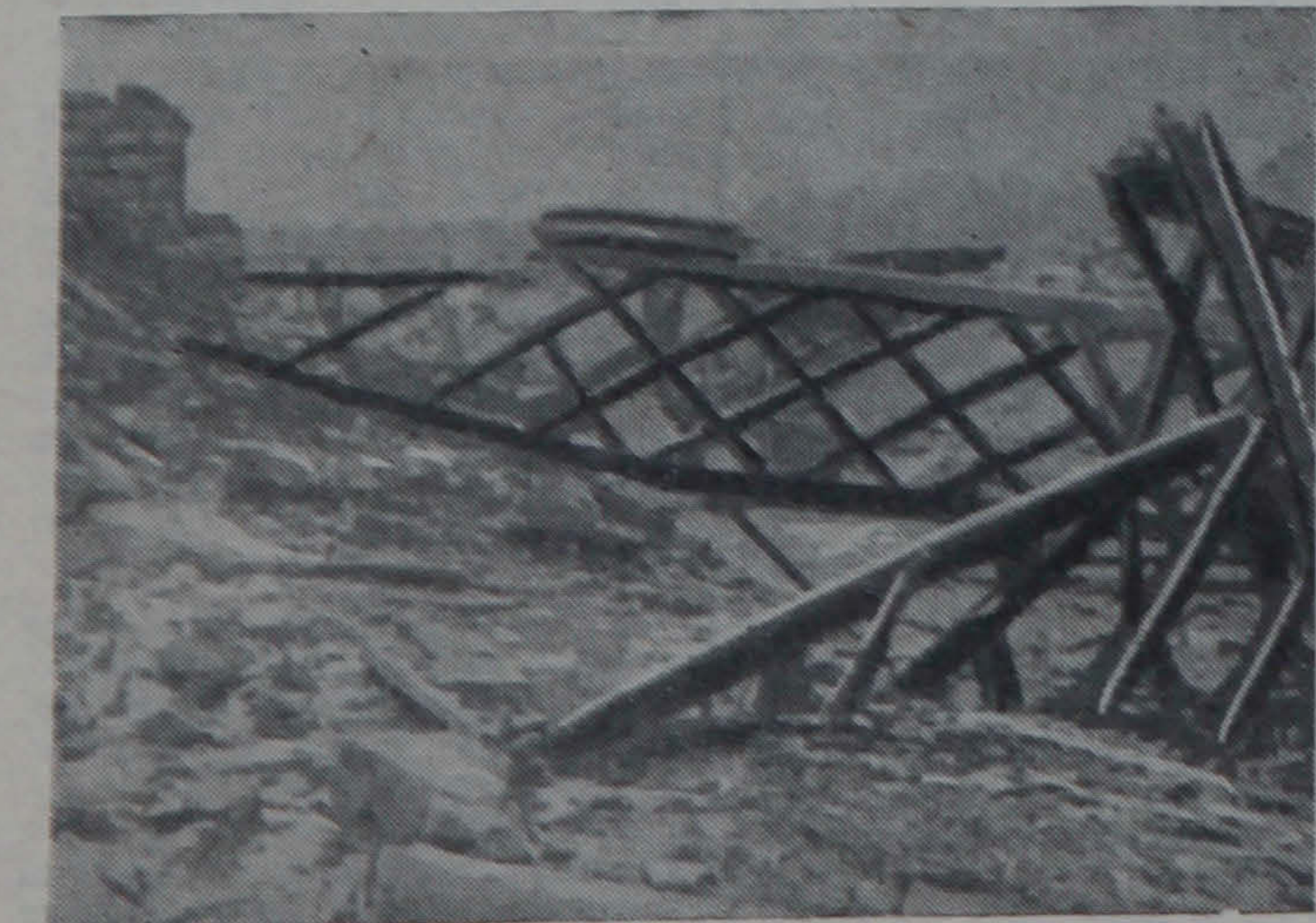
Железнодорожный мост, подорванный в тылу немецко-фашистских войск десантниками бригады Гриднева.

Наш адрес: Главный корпус, комн. 101-а; телефоны: 158-89-70, 3-71.