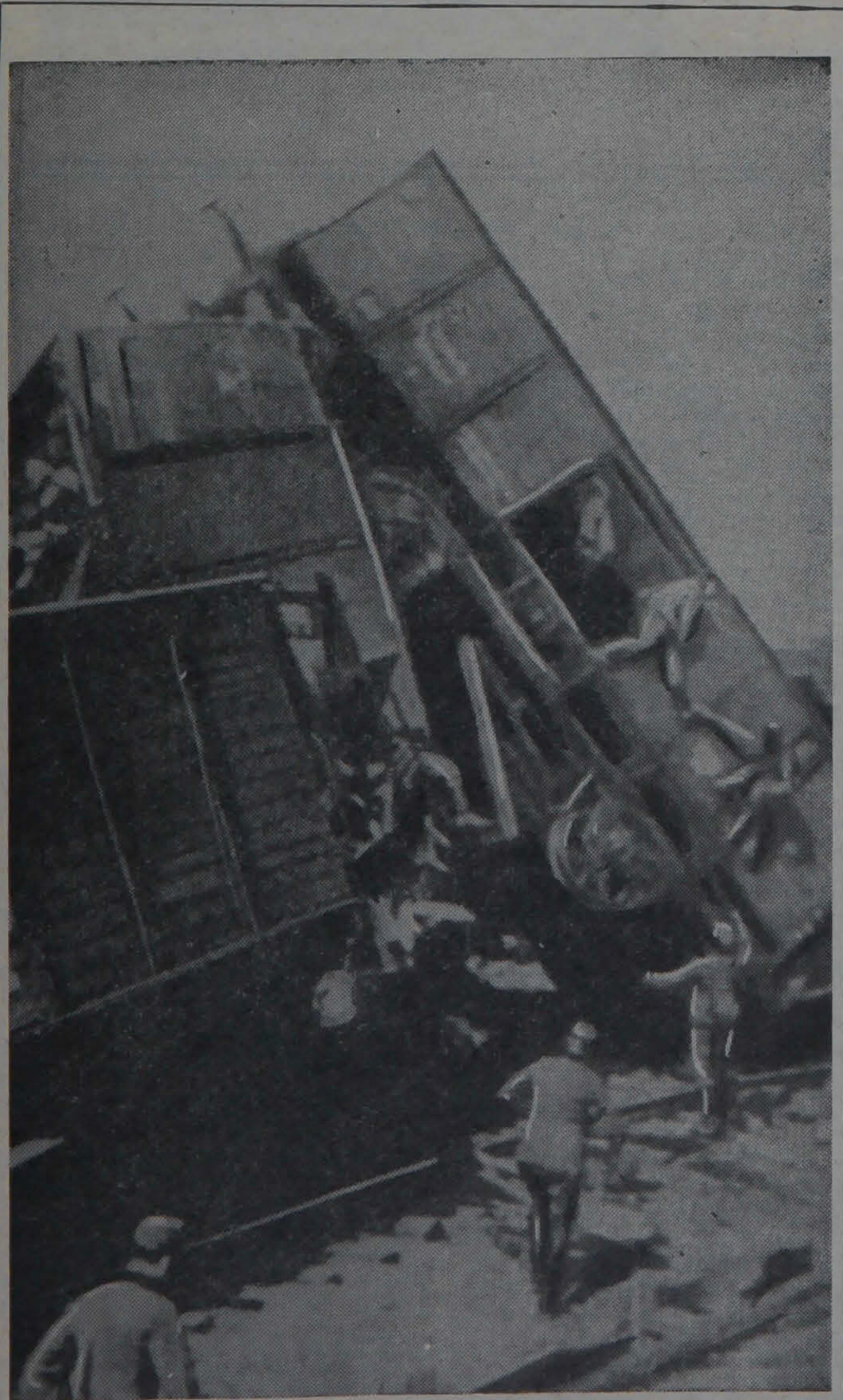
Успех советских воинов в суровые годы войны во многом зависел от тех, кто приближал день Великой Победы в тылу врага. Об одной из бригад особого назначения, действовавшей на оккупированной территории Белоруссии, читайте воспоминания В. Цыганко на 4-й странице.