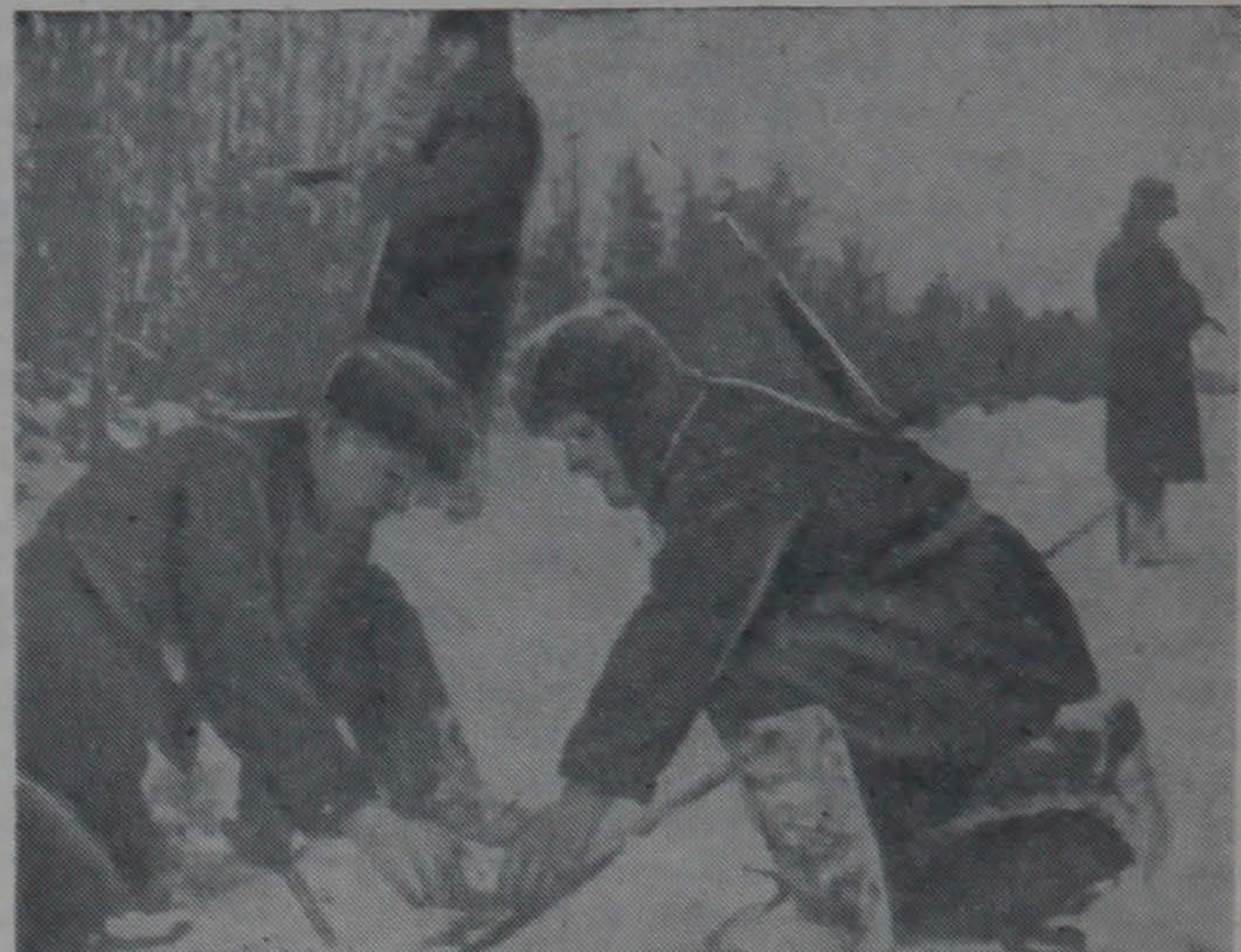
Подрывники бригады минируют железнодорожный путь во вражеском тылу.

Обо всем этом было сообщено в штаб Белорусского фронта. Командование выслало авиацию. Фронтные соколы ночью развесили «фонари» над аэродромом и нанесли массированный бомбовый удар. Многие фашистские самолеты были уничтоже-